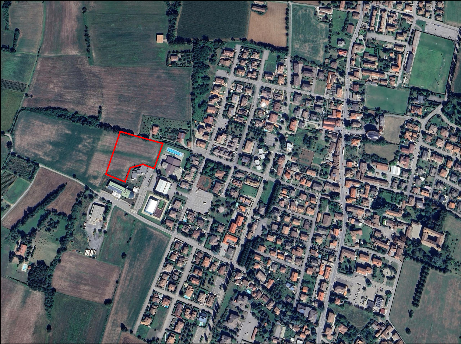
individuazione dei fabbricati oggetto di intervento in ortofoto